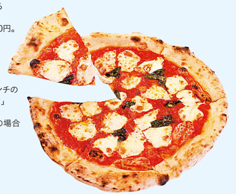
直径約30センチの「マルゲリータ」1,320円。 ※イトインの場合

3種類からパスタを選べる 日替わりランチセット 「ジョルナリエーロ」1,650円。 ※イトインの場合