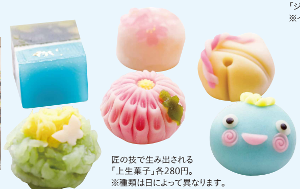
匠の技で生み出される「上生菓子」各280円。 ※種類は日によって異なります。