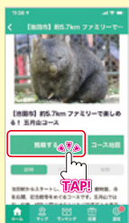
③「挑戦する」を押して ウォーキングスタート！