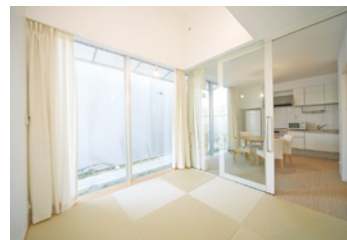
チャイルド・ケモ・ハウスの部屋