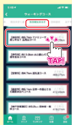
②「阪急観光あるき」 を選択し、コースを選ぶ (全16コース)