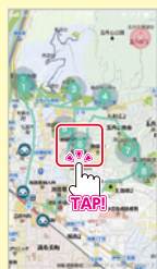
④コースの順に 各スポットをめぐる