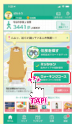
①「ウォーキングコース」 選択