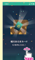
⑤スポットをめぐり、 コースを踏破すると 観光あるきカード1枚ゲット！