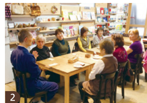
2 定期開催のワークショップ「写経カフェ」。写経で心を落ち着かせた後は、お坊さんとお茶を楽しみながらしばし相談。