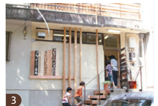
3 交流拠点「さたけん家」は、千里ニュータウン誕生の1962年に開店した本屋を、住民の手でリノベーションしてオープン。