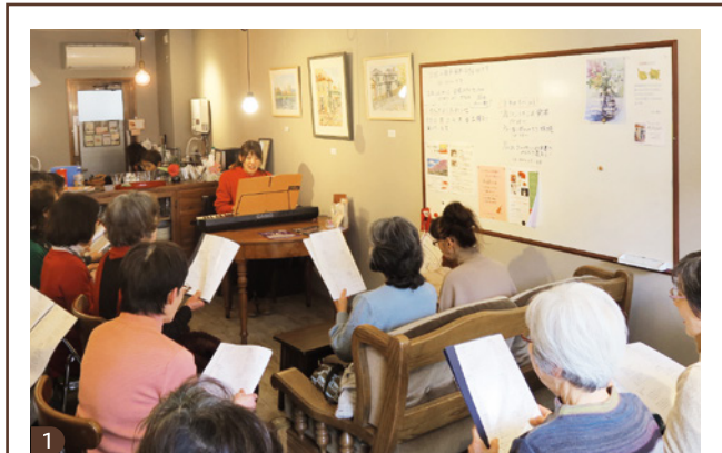
1 「うたごえ喫茶」は、毎回キャンセル待ちという大盛況のイベント。大勢で合唱を楽しむことで、心身共に健やかに。