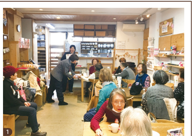
1 年齢を重ねても地域で元気に暮らすため、なるべく外に出かけてもらいたいとの思いからオープンした「さたけん家カフェ」。白い壁と木のぬくもりを感じる店内でいただけるのは、地元のママさんたちが作った、日替わりランチやスイーツなど。