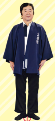
45度 | 45度