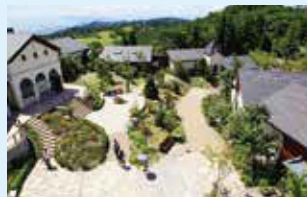
③六甲ガーデンテラス

スタート 六甲ケーブル 六甲山上駅 ➡ ①神戸ゴルフ倶楽部 ➡ ②みよし観音 ➡ ③六甲ガーデンテラス ➡ ④極楽茶屋跡 ➡ ⑤六甲山最高峰 ➡ ⑥魚屋道 ➡ ⑦杖捨橋 ➡ ゴール 瑞宝寺公園(有馬温泉)