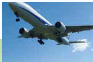
コース途中には飛行機が頭上を通るスポットも