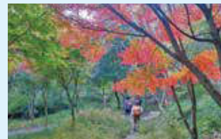
⑥ 紅葉を楽しめる山道