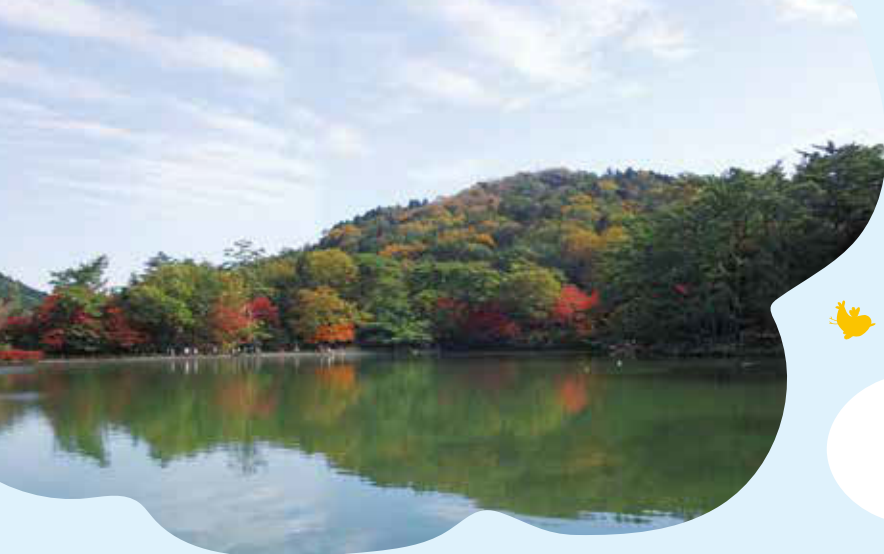
再度山の紅葉の風景(再度公園)