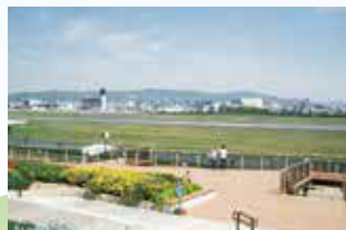
③伊丹スカイパーク

スタート 阪急石橋駅…石橋駅前公園 ➡ ①受樂寺(桂春団治の碑) ➡ ②下河原緑地 ➡ ③伊丹スカイパーク ➡ ④原田大橋 ➡ ⑤千里川 ➡ ⑥高校野球メモリアルパーク ➡ ゴール きたしん豊中広場…阪急豊中駅